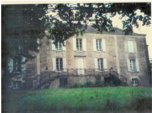
La Corderie, maison des coteaux